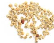
Graines de Psychotria viridis