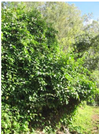
Banisteriopsis caapi bush

S'il vous plait, tenez compte des avertissements. Les expériences d'utilisation montrent que cette décoction peut causer de sérieux problèmes physiques et mentaux à ceux qui ignorent la connaissance indigène ou occidentale au sujet de la pratique chamanique. Ceci dit, vous êtes proche à embarquer pour une aventure mystique d'une qualité extraordinairement riche, bienfaisante, transcendante et émouvante.