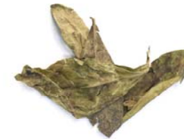
Feuilles de Psychotria viridis Spirit Elixir contient un composant visionnaire que chaque mammifère et beaucoup de plantes produisent.